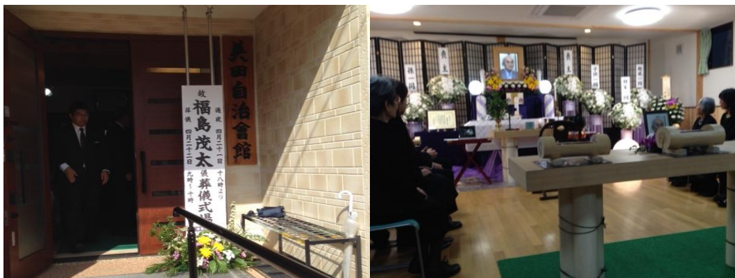
美田モデルの例(平成26年4月22日福島家ご葬儀の様子)