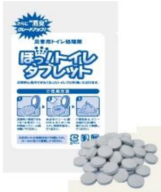
説明会で紹介された『ほっ！トイレダブレット』